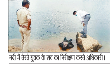
नदी में तरेते युवक के शव का निरीक्षण करते अधिकारी।

2 दिन पहले तीन दोस्त पिकनिक मनाने हसदेव नदी तट पर गए हुए थे। जहां नदी में नहाने के दौरान एक युवक डूब गया था। जिसकी परिजनों द्वारा खोजबीन की जा रही थी लेकिन उसका कुछ पता नहीं चल पा रहा था। तीसरे दिन लापता युवक का शव नदी से बरामद कर